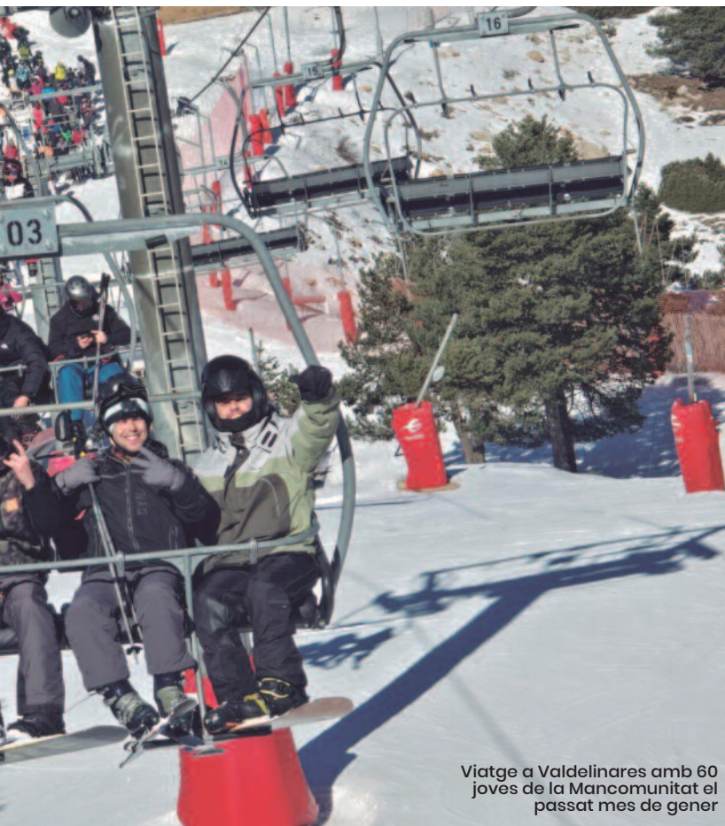
Viatge a Valdelinares amb 60 joves de la Mancomunitat el passat mes de gener

varro. Una altra de les preocupacions que més sovint sorgeix és la necessitat de millorar el transport públic. «Hi ha localitats que no tenen metro ni connexions entre pobles. Alguns són municipis xicotets amb pocs recursos, i això dificulta l'accés a activitats o llocs d'estudi i treball», reconeix la tècnica. El Pla de Joventut també recull aquesta