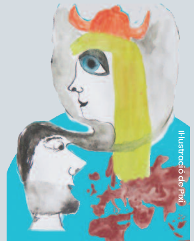
Il·lustració de Pixl