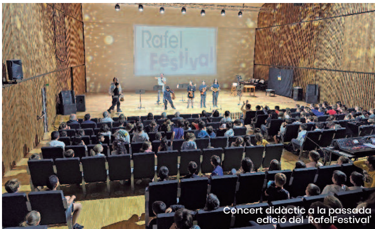
Concert didàctic a la passada edició del 'RafelFestival'

El festival oferirà una completa programació entre el 5 i el 9 de novembre, comptant amb la participació del reconegut pianista, investigador i creador multimèdia Zubin Kanga, qui oferirà a Rafelbunyol el seu primer concert a Espanya. Mostrarà el seu treball amb electrònica en temps real i projeccions visuals, exem-