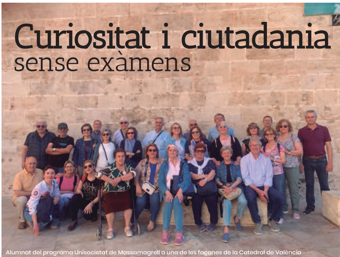
Alumnat del programa Unisocietat de Massamagrell a una de les façanes de la Catedral de València

REDACCIÓ Eduard Ramírez