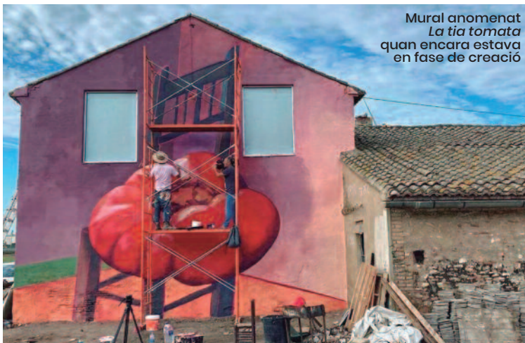
Mural anomenat La tia tomata quan encara estava en fase de creació