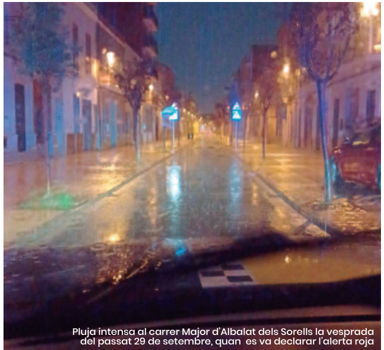
Pluja intensa al carrer Major d'Albalat dels Sorells la vesprada del passat 29 de setembre, quan es va declarar l'alerta roja