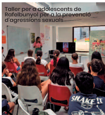
Taller per a adolescents de Rafelbunyol per a la prevenció d'agressions sexuals

En eixa línia, amb l'objectiu de convertir-los en protagonistes dels municipis, la Mancomunitat de l'Horta Nord desenvolupa fins 2027 el seu primer Pla de Joventut, amb accions que consoliden la política juvenil com una eina participativa, transversal i arrelada als pobles. «S'ha fet un esforç molt fort des dels municipis per a apostar per la joventut, donant recursos i pressupost. En l'àmbit de participació se'ls està tenint molt en compte», explica Pilar Navarro, tècnica de Joventut de la Mancomunitat. Des que la professional s'incorporà al de-