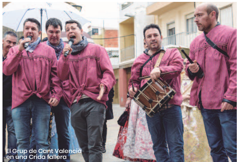
El Grup de Cant Valencià en una Crida fallera

A Espai Carraixet hem tingut la sort d'escoltar-los en directe en una presentació de la revista, i ens van acariciar el cor. ■