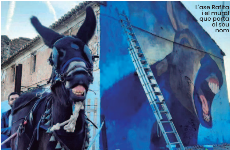
L'ase Raffita i el mural que porta el seu nom

Al remat, si mirem en clau local, com exposa l'alcalde d'Alboràia, «l'horta és un dels pilars del Pla Estratègic de Turisme de l'Ajuntament, per la qual cosa aquesta iniciativa reforça el nostre compromís amb ella». En els murals de l'horta apareixen llauradors, paisatges agrícoles i símbols de la tradició, al costat de reflexions sobre el present i futur. Són una nova manera d'expressar la nostra identitat. ■