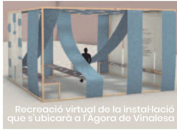
Recreació virtual de la instal·lació que s'ubicarà a l'Agora de Vinalesa

tada del número 3 (2018). Hache ha creat "Els invisibles", un projecte per a observar les persones que no es veuen però que treballen la terra. Aquesta obra assenyalava l'absència dels cossos que sostenen el territori i la seua producció.