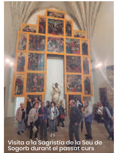
Visita a la Sagristia de la Seu de Sagorbu durant el passat curs

La Universitat de València estén els braços per arropir desenes d'alumnes més enllà de les instal·lacions oficials i de la formació reglada, i Massamagrell és un exemple d'agraïment a través de totes les persones encuriosides que disfruten dels ensenyaments. ■