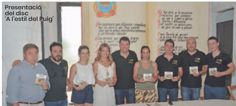
Presentació del disc "A l'estil del Puig"