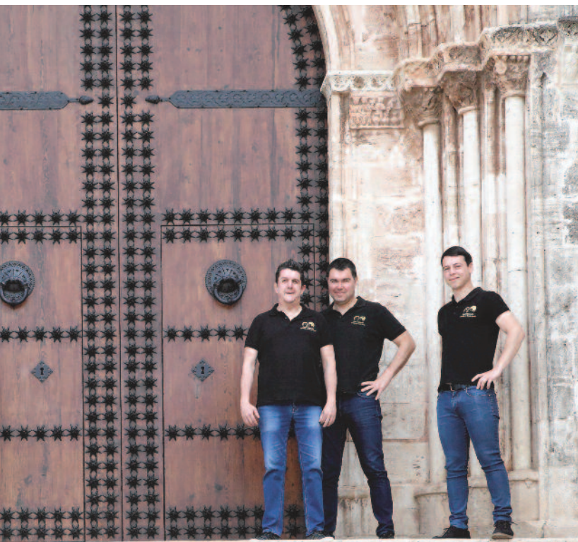
Membres del Grup de Cant Valencià a la porta del monestir del Puig de Santa Maria