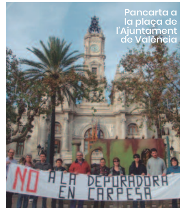
Pancarta a la plaça de l'Ajuntament de València