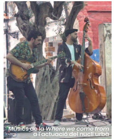
Músics de la Where we come from a l'actuació del nucli urbà

Alboraia és destí, i Alborajazz és l'excusa perfecta per a vindre, quedar-se i enamorar-se de tot el que a Alboraia ofereixen, en estiu i durant tota la resta de l'any. ■