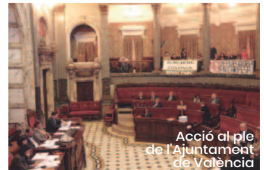
Acció al ple de l'Ajuntament de València