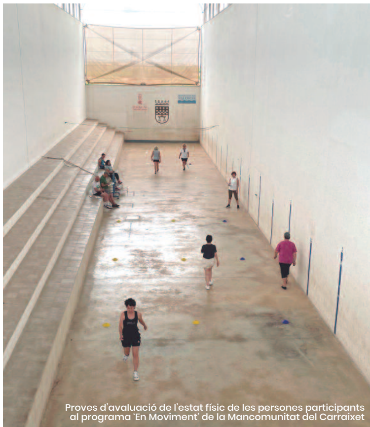
Proves d'avaluació de l'estat físic de les persones participants al programa 'En Moviment' de la Mancomunitat del Carraixet

Tal és la magnitud de l'impacte de l'esport en les nostres vides, que la Mancomunitat del Carraixet s'ha sumat al projecte