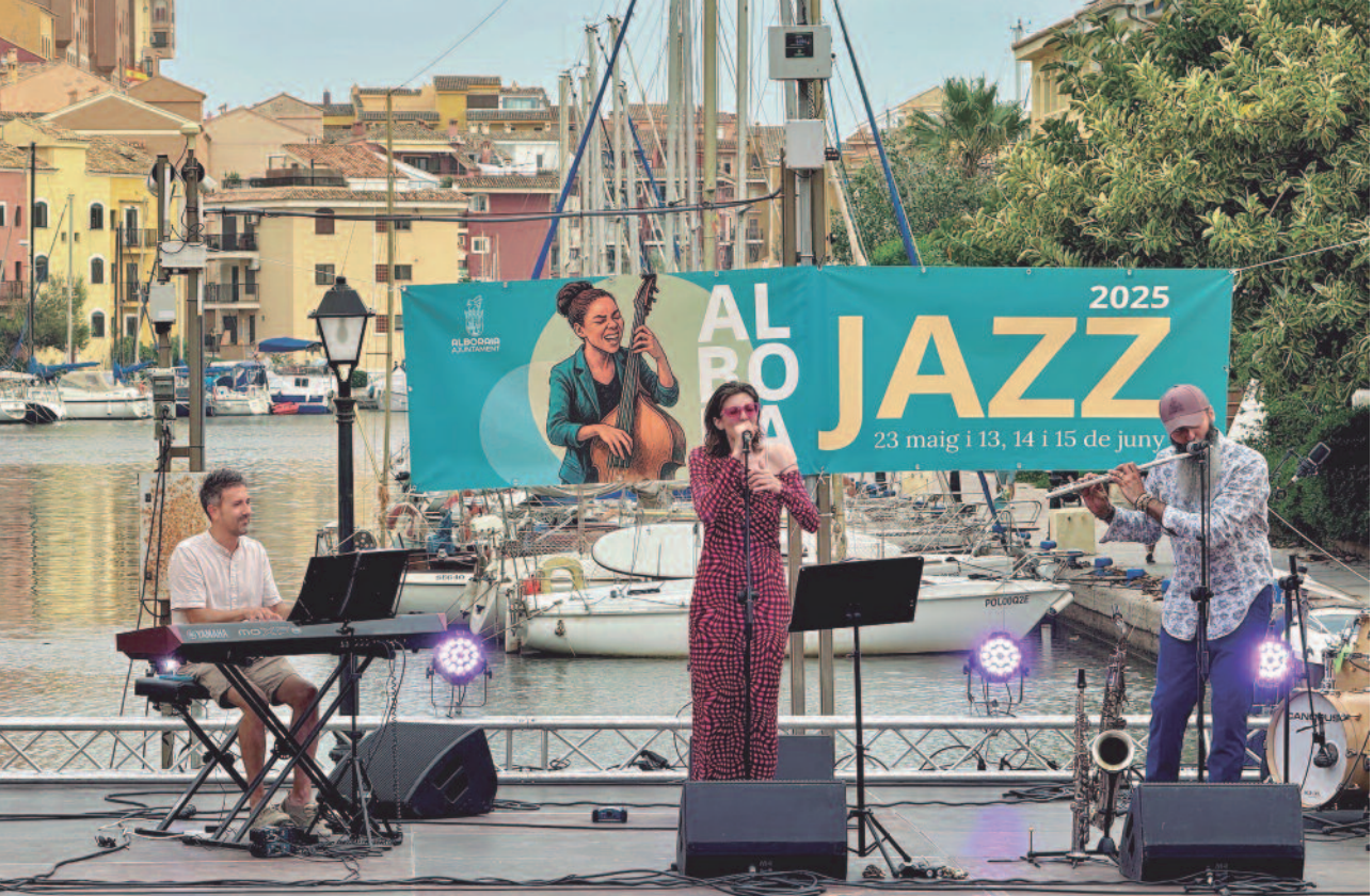
Actuació de Pop'in Jazz a la marina de Port Saplaya