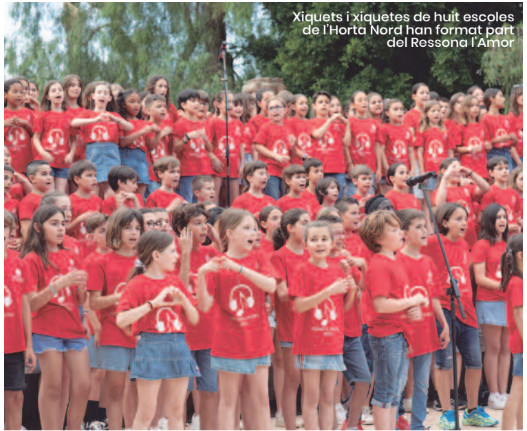
Xiquets i xiquetes de huit escoles de l'Horta Nord han format part del Ressona l'Amor

Ressona l'Horta no és només un concert infantil: és un esdeveniment comunitari que fa bategar la cultura des de la base, des de les escoles i les places. En aquesta edició, celebrada en