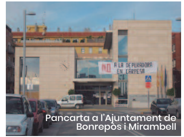
Pancarta a l'Ajuntament de Bonrepòs i Mirambell

Castells i Larena conclouen amb la necessitat de connectar-nos, prendre la paraula i la iniciativa, i no deixar-nos arraconar per imposicions exteriors: «Una vegada més, els esdeveniments ens demostraren la importància d'un moviment veïnal que va sorgir espontàniament contra la implantació d'una macrodepuradora que destrossava una part important d'horta protegida en producció, posava en perill la salut de les persones a més d'un estil de vida propi, i alhora comprometia seriosament l'equilibri mediambiental. La depuració de les aigües és necessària, però hi ha alternatives molt més interessants que tenen en compte la sostenibilitat». Perquè som poble, som ciutadania, i no volem quedar muts i arrimats al marge. ■