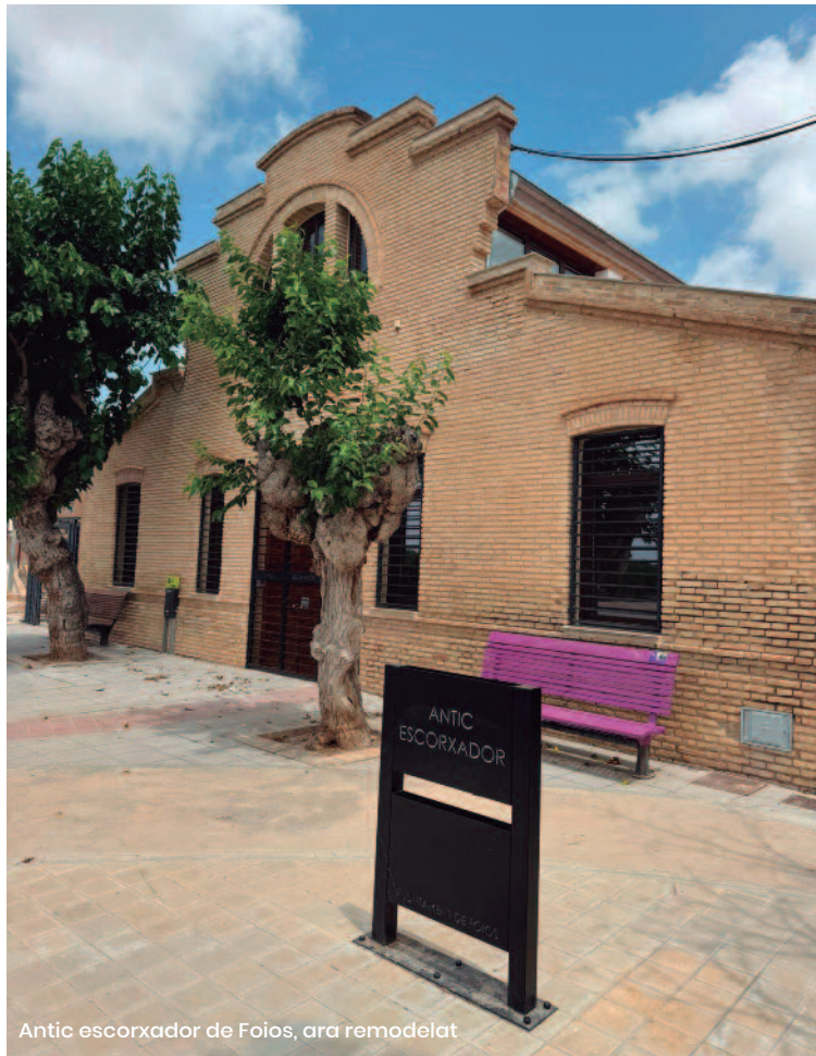
Antic escorxador de Foios, ara remodelat

Amb l'aigua de la séquia no ens atrevíem a més. L'experièn-