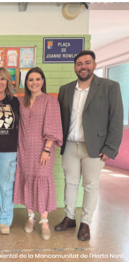
iental de la Mancomunitat de l'Horta Nord

de Primària, Segon Cicle de Primària, Tercer Cicle de Primària i la nova Secció Especial Familiar. Els dos dibuixos més votats de cada categoria han rebut un premi en forma de jocs educatius sobre medi ambient. A més s'ha reforçat l'efecte col·lectiu,