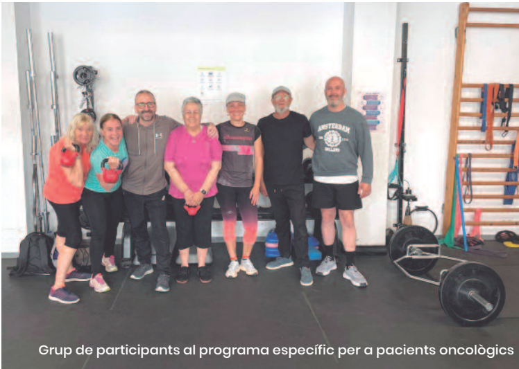
Grup de participants al programa específic per a pacients oncològics

passa una entrevista amb el preparador físic, que al seu torn, li passa unes proves físiques per a veure en quina situació es troba, per a veure com adaptar els moviments, coneixent cada cas de manera individual. A la incorporació al programa es comença amb tres sessions setmanals, dues de treball de força i un de moviment aeròbic. Cada tres mesos es repeteixen les proves físiques per a veure'n l'evolució i valorar-la. El programa té una duració de 9 mesos, i en finalitzar s'ofereix la incorpora-