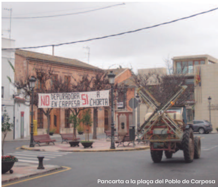
Pancarta a la plaça del Poble de Carpesa

Un moviment veïnal va aconseguir frenar l'any 2010 el projecte de construcció d'una macrodepuradora a l'horta de Carpesa