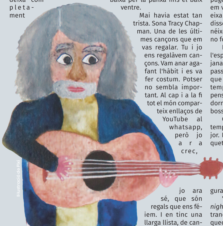
Il·lustració de Pixi

"Baby can I hold you tonight". Estic trista, però dormiré tranquil·la. Ja no estàs, però ens queden les cançons.