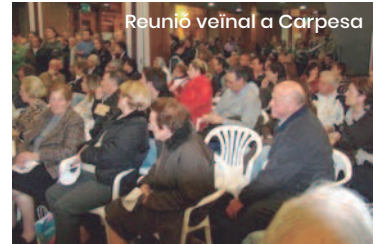
Reunió veïnal a Carpesa