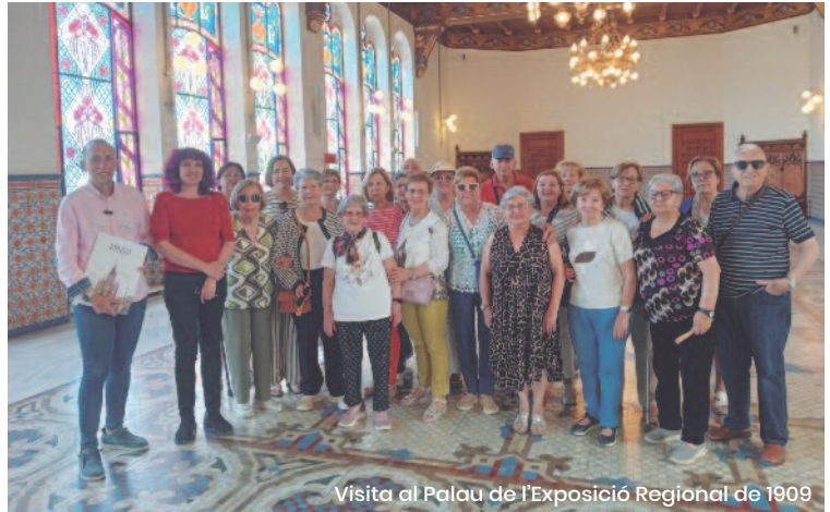
Visita al Palau de l'Exposició Regional de 1909

La formació de persones adultes d'Albalat dels Sorells programa excursions tots els mesos per a visitar espais patrimonials del Cap i Casal