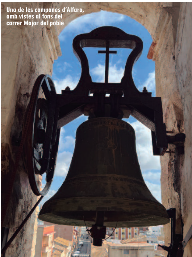
Una de les campanes d'Alfara, amb vistes al fons del carrer Major del poble

REDACCIÓ NELO VILAR