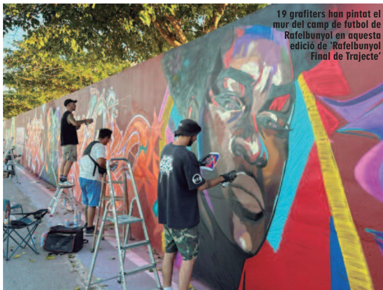
19 grafiters han pintat el mur del camp de futbol de Rafelbunyol en aquesta edició de 'Rafelbunyol Final de Trajecte'

Per tal de completar l'oferta plàstica del festival, enguany s'ha celebrat la segona edició de l'«Street Art Young» (SAY). Un projecte de l'Espai