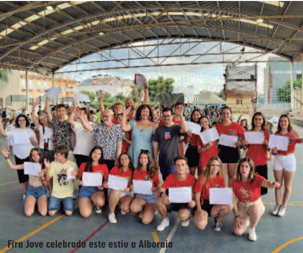
Fira Jove celebrada este estiu a Alborià