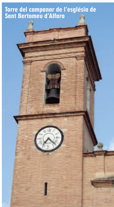
Torre del campanar de l'església de Sant Bertomeu d'Alfara

Quan pensem en “patrimoni” imaginem palaus, esglésies i en general edificis monumentals. Però el patrimoni és divers, pot ser immaterial i conservar-se només en les pràctiques comunitàries. Ha sigut recentment quan s’han començat a gravar festes, danses, músiques... Un d’estos patrimonis preciosos és el dels tocs de campana manuals, que des de 2022 està inscrit a la Llista representativa del Patrimoni Cultural Immaterial de la Humanitat per la UNESCO.