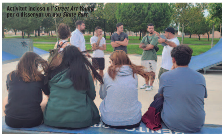
Activitat inclosa a l'«Street Art Young» per a dissenyar un nou Skate Parc

Rafelbunyol dona bon exemple d'activitats creatives de mirada ampla i estratègia de futur, que obri noves possibilitats de participació. El públic entre 12 i 25 anys troba també espais que reconeixen de manera positiva les seues aficions més properes, i el municipi alimenta un futur actiu d'implicació creativa per a la seua joventut. ■