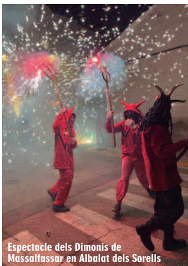
Espectacle dels Dimonis de Massalfassar en Albalat dels Sorells