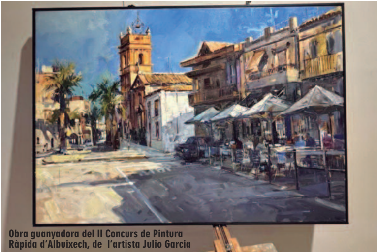
Obra guanyadora del II Concurs de Pintura Ràpida d'Albuixech, de l'artista Julio García

Continuant el passeig, al llarg del carrer Major pintaven diversos artistes, també a l'església i d'altres llocs als afores com ara l'horta o el depòsit de coloms. L'estil i la tècnica eren lliures i personals, dins de la temàtica comuna d'Albuixech i el seu conjunt de carrers, gents i paisatges locals.