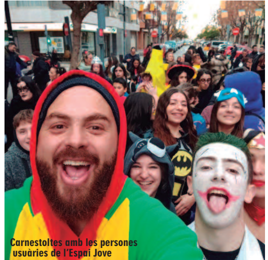
Carnestoltes amb les persones usuàries de l'Espai Jove