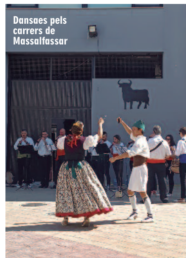
Dances pels carrers de Massalfassar