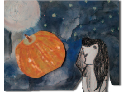
Il·lustració de Pixi

El matí del diumenge era una festa. Els veïns seguien les línies de les carabasses i ja en tenien prou per a parlar. Si no entenien com la xica havia pogut rebutjar aquell fadrí amb tantes fanecades, si s'havia