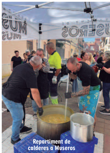
Repartiment de calderes a Museros