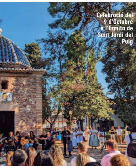
Celebració del 9 d'Octubre a l'Ermita de Sant Jordi del Puig