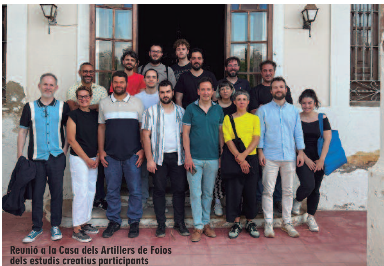
Reunió a la Casa dels Artillers de Foios dels estudis creatius participants

Totes les obres es comprometen a incloure garanties de sostenibilitat utilitzant materials que puguen ser reciclats o reutilitzats en tot el seu procés, podent ser entregades amb