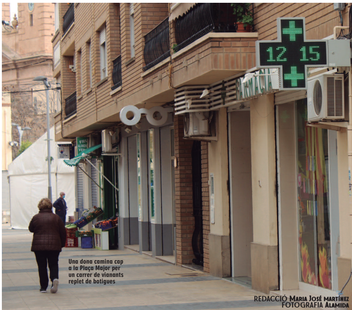
Una dona camina cap a la Plaça Major per un carrer de vianants replet de botigues

Almàssera vol convertir-se en el referent del comerç de proximitat a la comarca