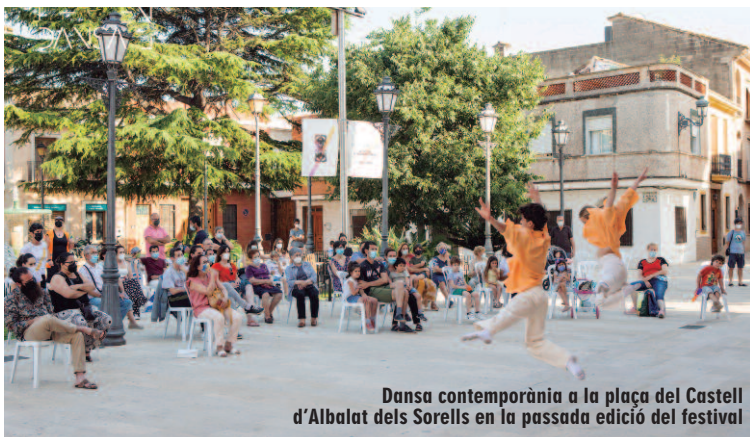
Dansa contemporània a la plaça del Castell d'Albalat dels Sorells en la passada edició del festival

El programa reuneix a Albalat companyies i artistes del territori