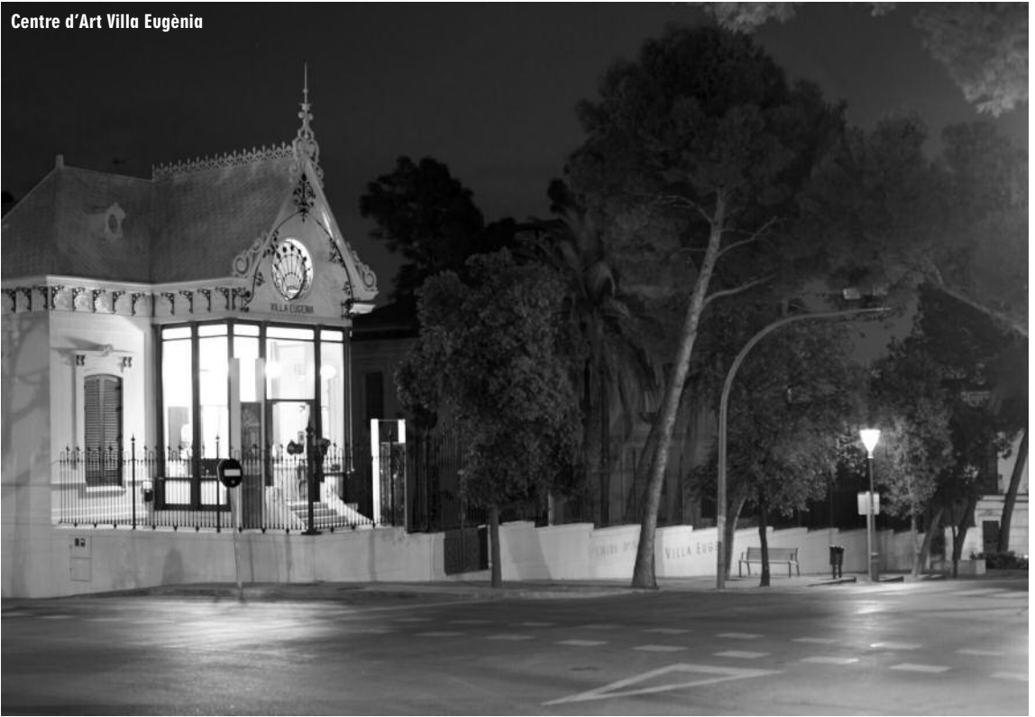
Centre d'Art Villa Eugènia

també en el Teatre Capitolí, la seua visió de la música a través d'una obra mediterrània, contemporània i universal. El cantautor expressarà a través de la seua música al públic godellenc el seu ampli i exquisit univers musical.