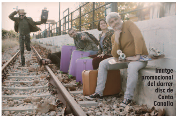
Imatge promocional del darrer disc de Canta Canalla

Inaugurà la seua trajectòria com a poeta l'any 2003 a Catarroja, amb 'Ideologari', dins de la col·lecció de poesia L'Alter. Amb 'La quadratura del cercle' guanyà el premi Manel Rodríguez Martínez d'Alcoi, que edità Brosquil l'any 2006. Edicions 96 li publicà el 2007 'Càbala',