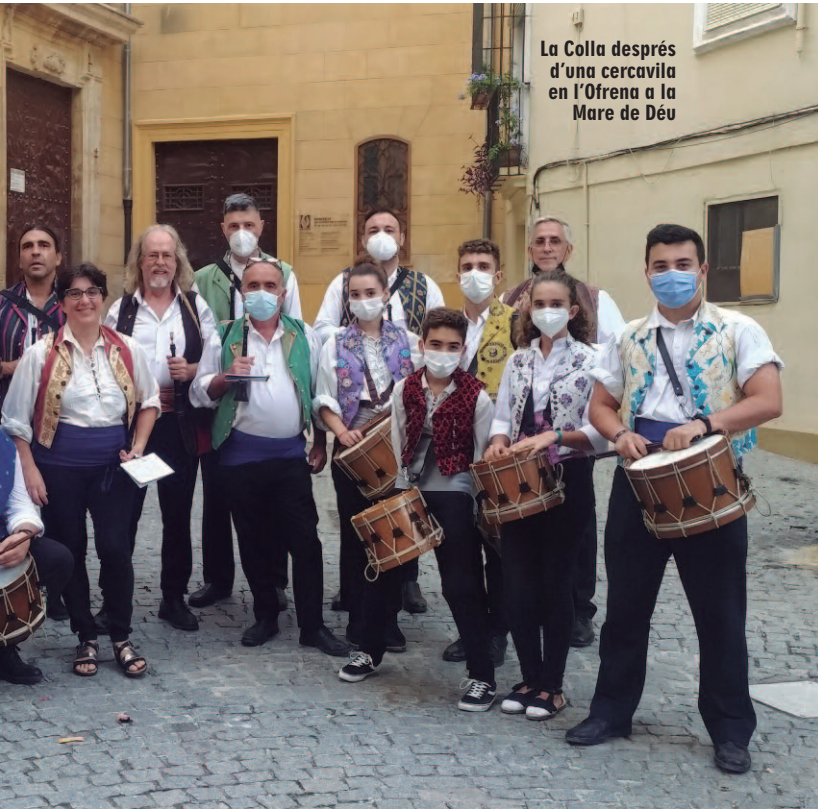
La Colla després d'una cercavila en l'Ofrena a la Mare de Déu