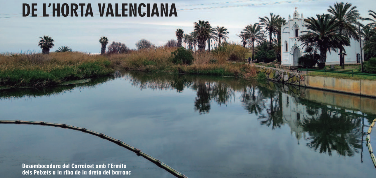
Desembocadura del Carraixet amb l'Ermita dels Peixets a la riba de la dreta del barranc

L'ERMITA DELS PEIXETS D'ALBORAIA ÉS SENYA D'IDENTITAT DEL POBLE I UN LLOC EMBLEMÀTIC DE L'HORTA VALENCIANA