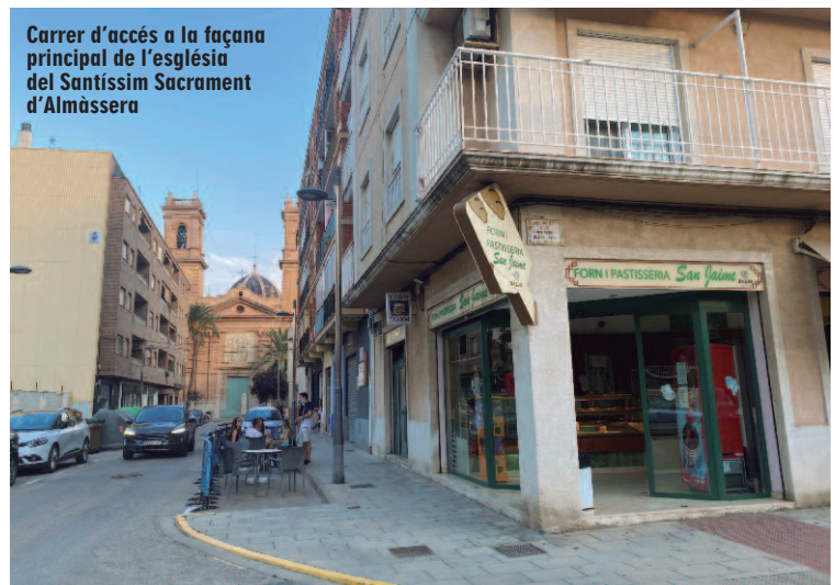
Carrer d'accés a la façana principal de l'església del Santíssim Sacrament d'Almàssera