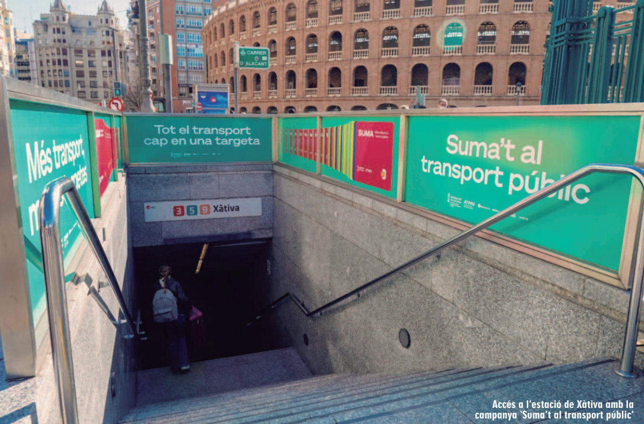
Accés a l'estació de Xàtiva amb la campanya 'Suma't al transport públic'