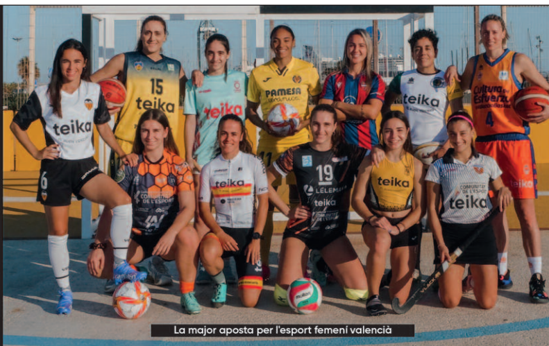
La major aposta per l’esport femení valencià