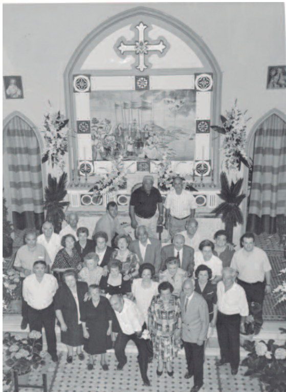
Els festers de l'any 1998, en l'interior de l'Ermита