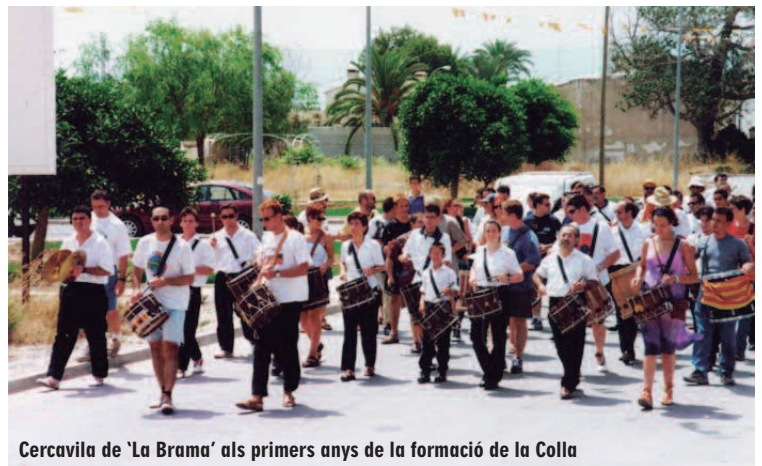
Cercavila de 'La Brama' als primers anys de la formació de la Colla

'La Brama' ha fet un llarg recorregut per a divulgar el nostre llegat musical, camí en el qual continua amb molta activitat. La curiositat i l'in-